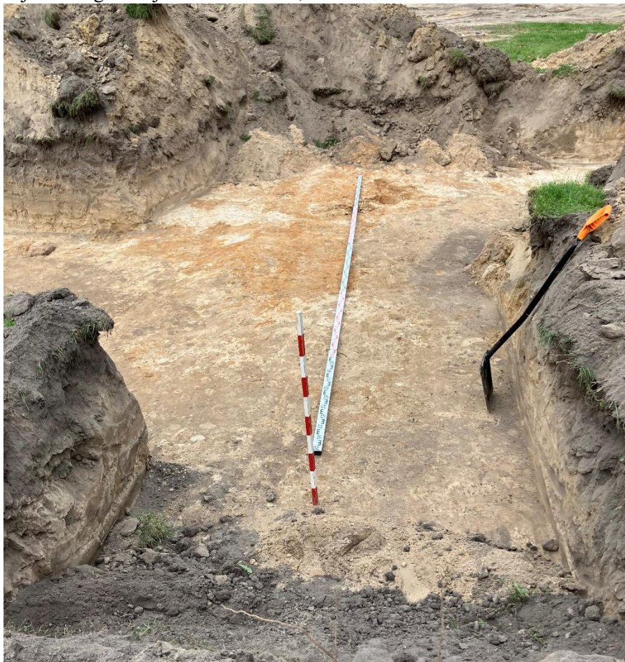
Łuk opaski zachodniego parteru od strony pałacu po zachodniej stronie głównej osi założenia o promieniu 1,7 m.

Odkrycie północnego zakończenia wschodniego pasa wzdłuż głównej osi założenia (Wykop nr 13) oraz południowo-zachodniego łuku parteru (wykop nr 8) pozwoliło na jednoznaczne stwierdzenie, że na placu wokół fontanny od strony głównej osi istniały łuki. Zapewne o takim samym promieniu jak łuk opaski parteru po zachodniej stronie głównej osi założenia - 1,7 m.