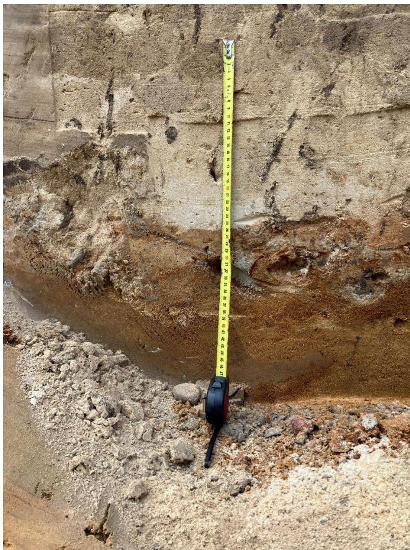
Przekrój przez parter

Wydaje się, że podczas przebudowy ogrodu prowadzonej przez Szlubowskich w XIX wieku nie zniszczono parteru, ale przykryto go warstwą ziemi, na której założono trawnik. Natomiast wprowadzenie grupy modrzewi (Istniejące do dziś dwa modrzewie na wschodnim parterze-pomniki przyrody) całkowicie zniszczyło parter w obrębie systemu korzeniowego. Największe zniszczenia powstały po II Wojnie Światowej. Nasadzenia drzew w obrębie parterów i opasek parterów całkowicie zniszczyły rokokowy rysunek. Całkowitemu zniszczeniu uległ teren bezpośrednio przy pałacu. Nie istnieje południowy brzeg parteru. Być może związane to było z działalnością Szlubowskich lub odbudową pałacu po pożarze w 1944 roku.