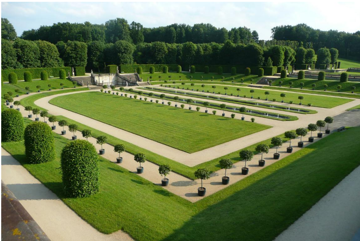
Großsedlitz. Parter przed dolną oranżerią. www.sumflower66.eu

Order wręczano przed dolną oranżerią, przed którą rozciągał się salon, który był inspiracją dla radzyńskiego założenia.