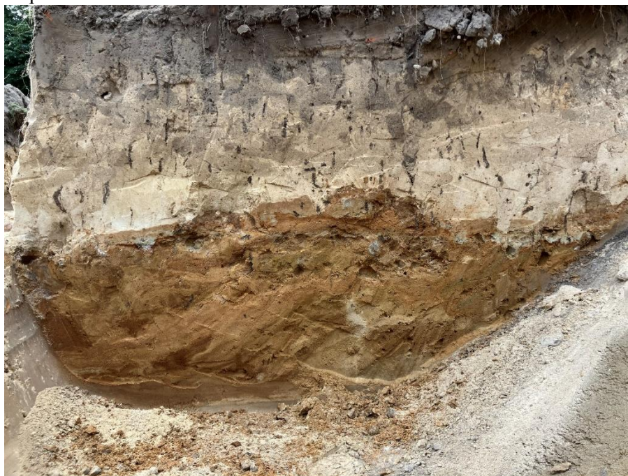
Przekrój przez parter-Wyraźnie widać tło z piasku i wzór z mialu ceglanego z gliną

Nie stwierdzono obecności żadnych obrzeży, co świadczy o tym, że w okresie letnim parter musiał być zraszany wodą by się nie rozpadł.